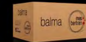
75 cl. 6 bottles 750 ml. 6本パック