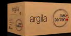
75 cl. 6 bottles 750 ml. 6本パック