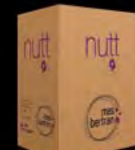
75 cl. 6 bottles 750 ml. 6本パック