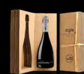
argila gift box アルジエラ ギフトボックス