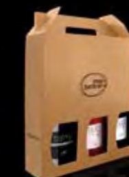
3 bottles case 3本パック